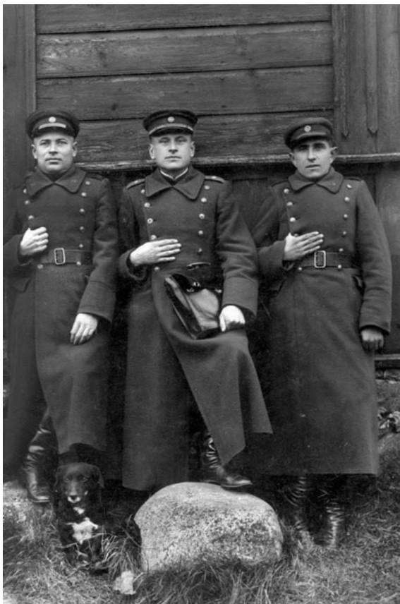
Lietuvos policijos pareigūnai su ištikimu draugu

Nuovados bendrabutyje dingdavo daiktai ir pinigai. To anksčiau niekada nepasitaikydavo. Vadinas, pradėjo veikti „bolševikinis“ teisingumas, tikrąjį savo veidą parodė naujieji „tvarkos teisingumo priežiūros“ atstovai.