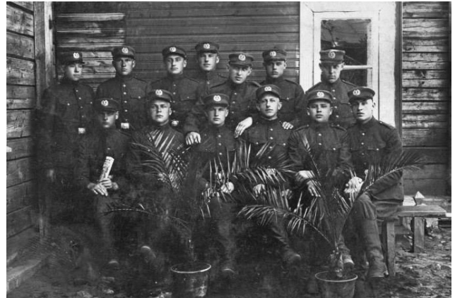
Karo policijos mokyklos kursantai, Kaunas, 1932 m. gegužės 17 d.

Vilniečius pirmiausia žavėjo itin gražiai nuaugę lietuviai policininkai, visada tvarkingai ir švariai apsirengę, o svarbiausia, visur ir visada pasiruošę gyventojams kuo nuoširdžiausiai padėti ir pagelbėti.