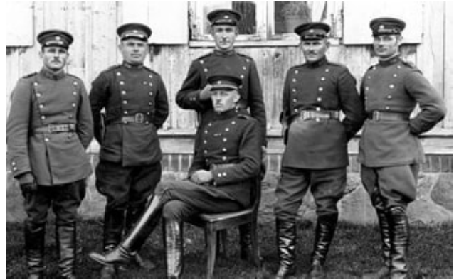
Lietuvos pareigūnai tarpukario metu

Vėliau padėtis normalėjo. Pirmieji veteranai (ir kariuomenėje, ir policijoje), atlikę savo pareigą Tėvynei, savo postus užleisdavo jaunosioms kartoms. Tuomet labai sparčiais žingsniais Lietuva žygiavo atsistatymo, švietimo ir pažangos keliu. Su dideliu užsidegimu buvo stengiamasi praplėsti ne tik viso krašto, bet ir atskirų žmonių, valstybės pareigūnų akiratį. Tuomet buvo tobulinama, šviečiama ir tvarkoma begaliniai didelės atrankos principu ir Lietuvos policija. Netgi eilinių policininkų postams užimti buvo keliami gana aukšti reikalavimai. Kiekvie-